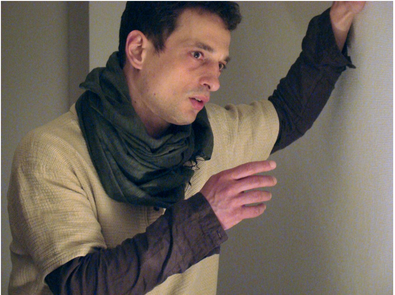
Die Nacht der Ölbäume