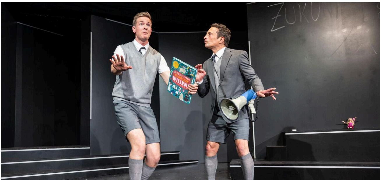
Das Gewicht der Ameisen